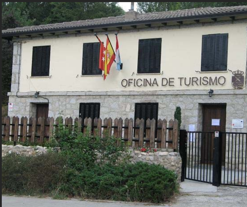
Rascafría (Madrid).

En la mayor parte de los casos, las oficinas y centros públicos ofrecen todo tipo de información turística en soporte digital y físico, consistente en material divulgativo editado por la administración con competencias ambientales/turísticas (folletos, guías, planos guías, etc.),