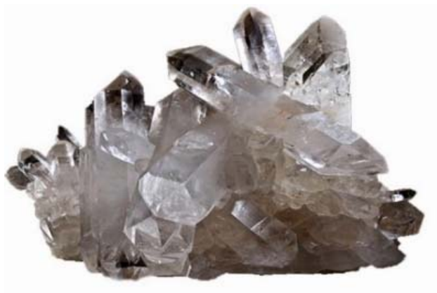
Cristal De cuarzo

Estos tres procesos son los que generan cristales de minerales, que pueden tener mucha variedad de tamaños, colores y formas.