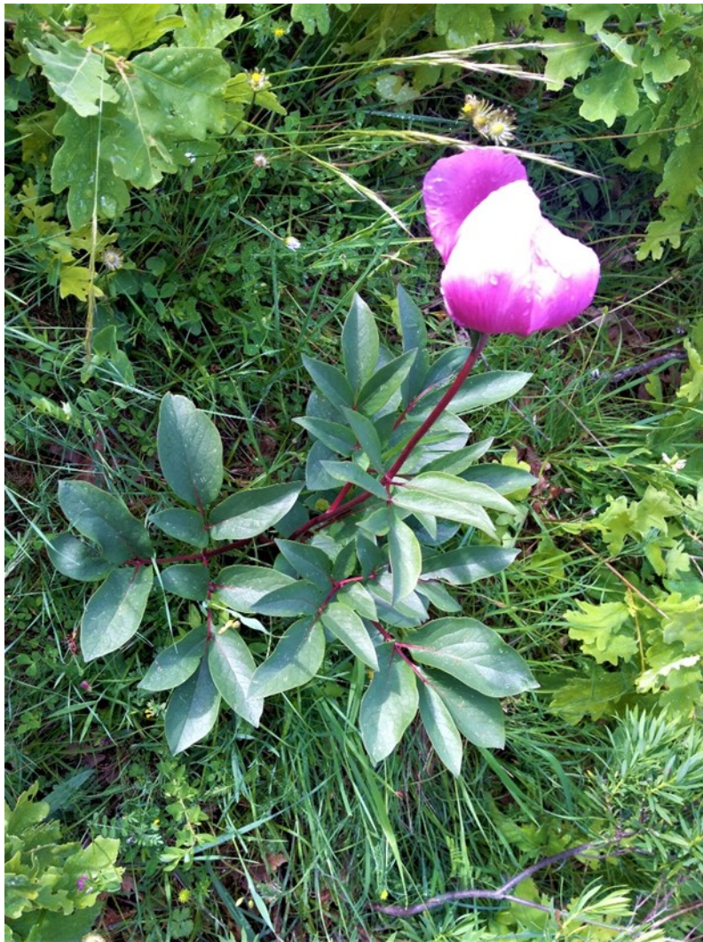
Paeonia broteroi (peonía)