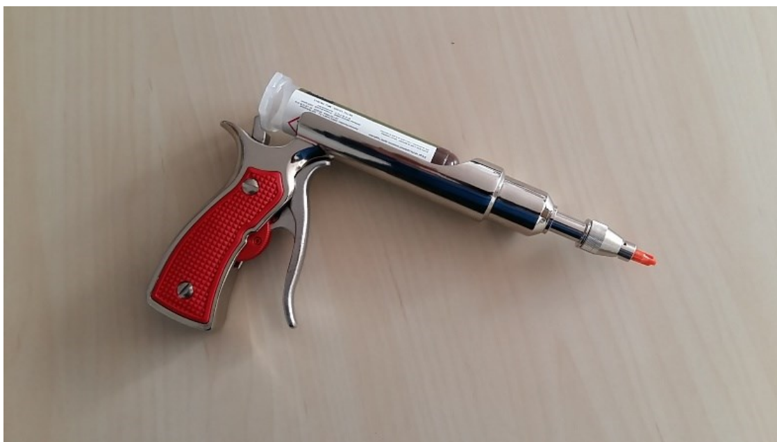
Inyector para cucarachas.

Para realizar las inyecciones se utilizan los inyector o pistolas de inyección, que se componen de un depósito, que contiene el líquido a inyectar con una bomba que lo impulsa por el interior del cilindro, el cual, termina en un punzón de hierro hueco que se clava en el suelo, y con un orificio, próximo a la punta, por el que sale el líquido.