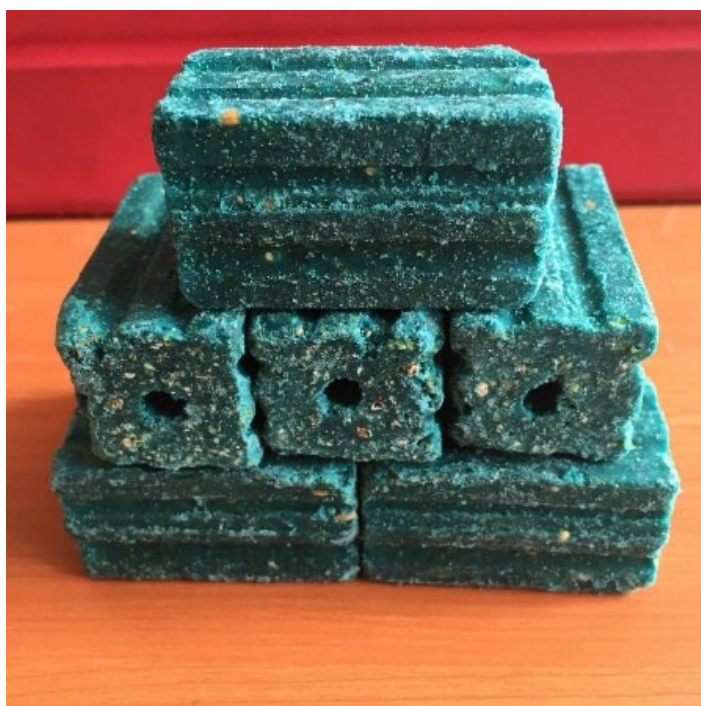
Bloques de cebo para roedores

La aplicación de cebos es más limpia, dirigida y segura que la de formulaciones para la fumigación. A diferencia de otras formulaciones, el cebo no implica el tratamiento indiscriminado de toda un área, sino el tratamiento puntual en las zonas donde crían los animales que hay que controlar.