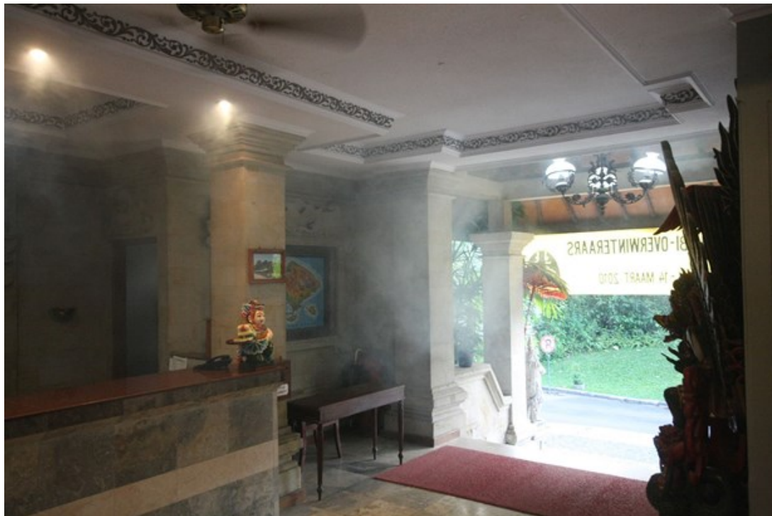
Instalación tratada con nebulizador

Los nebulizadores son pulverizadores neumáticos que se caracterizan por producir gotas muy finas, similares a la niebla. Constan de una turbina que produce aire a gran velocidad (80-160 m/s), en cuya corriente se deposita el líquido que es micronizado al chocar con la corriente de aire que lo transporta. El tamaño de la gota está comprendido entre 20 y 150 micras, según sea la velocidad del aire, con lo que se consigue una gran penetración.