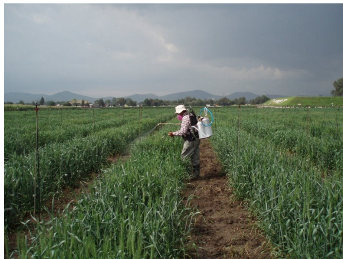
Pulverizador de mochila