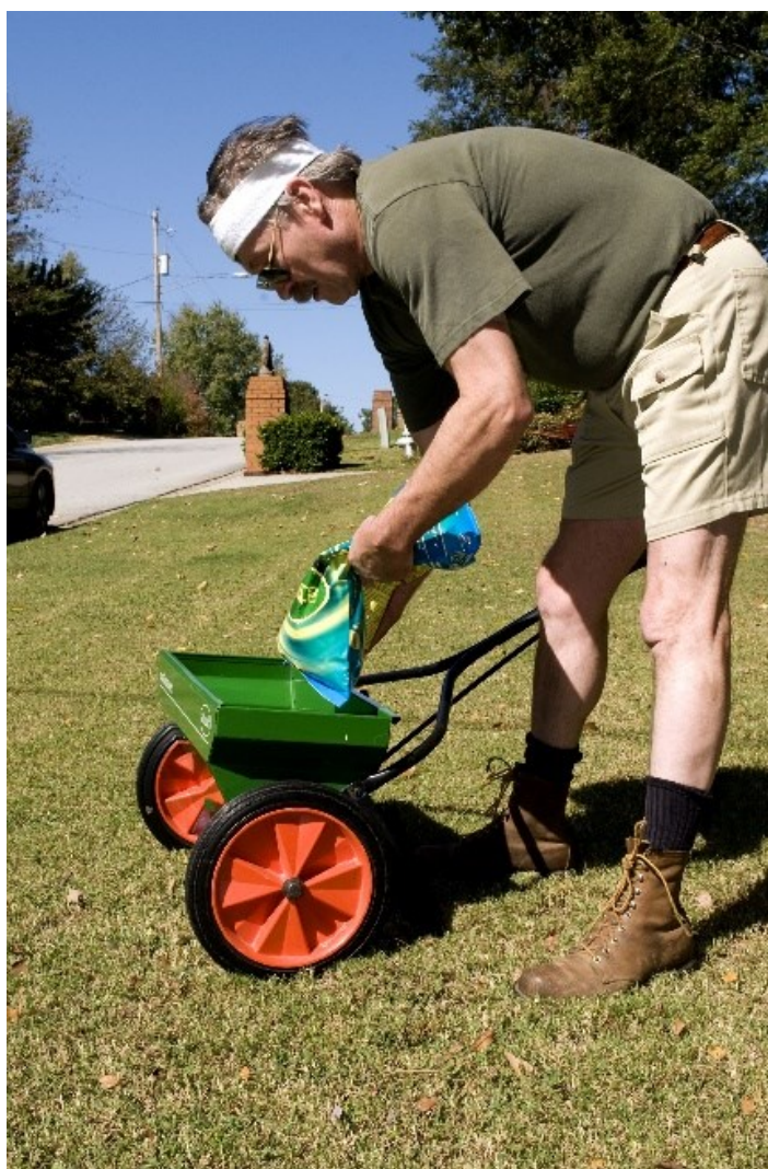
Aplicación de gránulos

En general las concentraciones de producto activo son bajas (del 1 al 10 %); el formulado no debe contener polvo, excepto las cantidades mínimas aceptadas por las tolerancias.