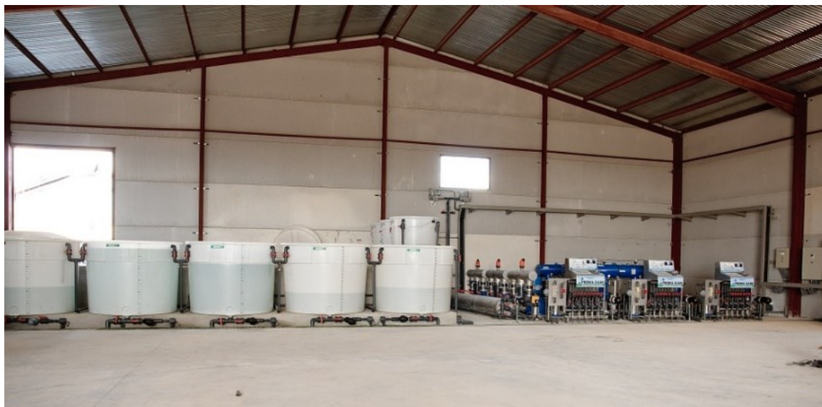
Tanques y bombas para fertirrigación