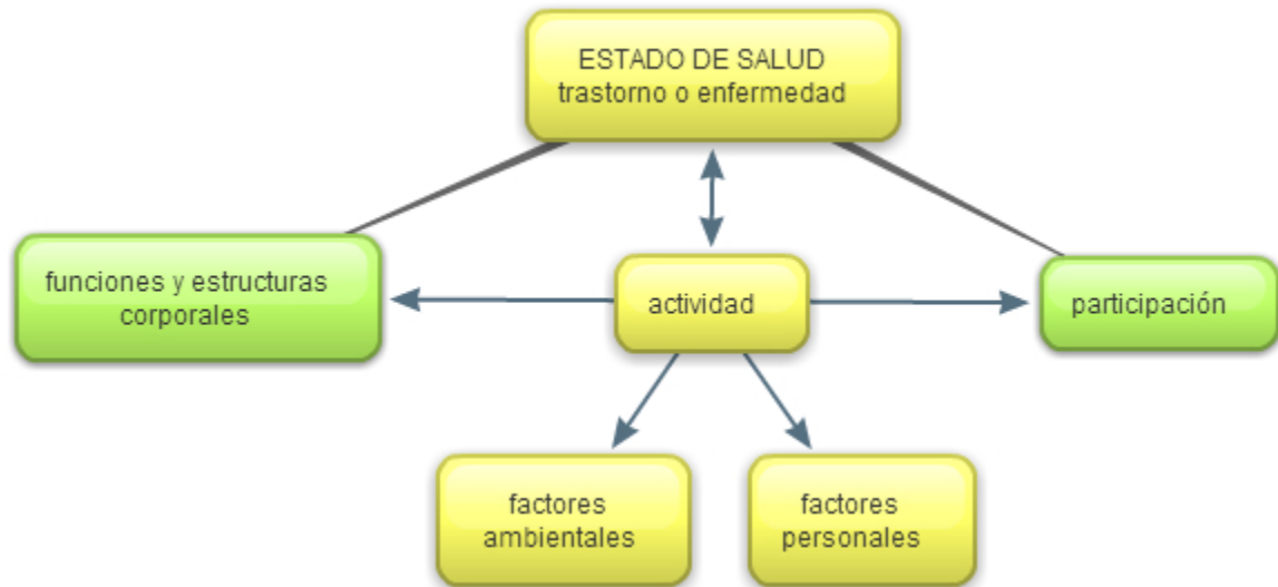
Imagen: Esquema de la estructura de la CIF

Los componentes de Funcionamiento y Discapacidad de la Parte 1 de la CIF se pueden emplear de dos maneras. Por un lado, pueden utilizarse para indicar problemas (ej., deficiencias, limitación en la actividad o restricción en la participación; todos ellos incluidos bajo el concepto global de discapacidad). Por el contrario, también pueden indicar aspectos no problemáticos (ej. neutrales) de la salud y aspectos “relacionados con la salud” (todos ellos incluidos en el concepto genérico de funcionamiento).