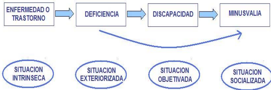
Imagen: Esquema lineal de discapacidad

Así la interacción de todos estos conceptos quedó reflejada en el modelo teórico adaptado en la CIDDM, el cual incorporó un esquema lineal de discapacidad, estableciendo una secuencia que iban desde el trastorno a la minusvalía, pasando por la discapacidad y la deficiencia.